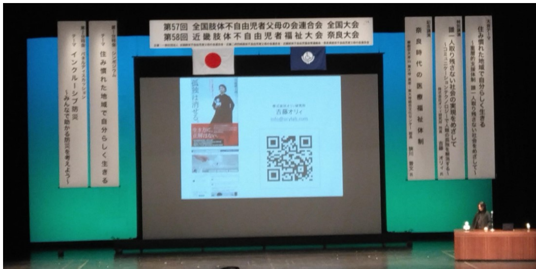
分身ロボットカフェ DAWN 2021 - AVATAR ROBOT CAFE DAWN 2021 (orylab.com)