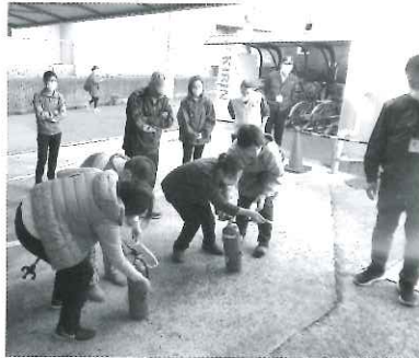
消火器を使った体験の様子

ビル内で火災が発生したという設定で、グループホームのある4階から1階へ非常階段を使って避難をしました。普段使い慣れない非常階段ということもあり、思いのほか避難に時間がかかることが分かりました。