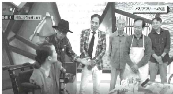
NHKバリバラ(障害者情報バラエティー)にて紹介されました。

今後は、これまで以上に活動内容を強化し、充実させ、障がい者のニーズに対応できるよう活動していきます。