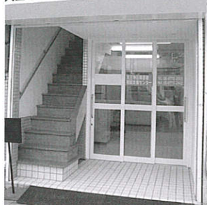
天王寺区障害者相談支援センター

障害者生活支援センター・いきいきは、平成27年4月から中央区に加え、新たに天王寺区の相談支援業務の委託を大阪市から受けました。