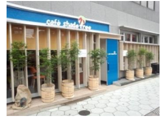
JR 玉造駅近くのカフェ「shade tree」