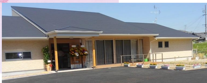
H29.6.1 交野市にオープン 《バリアフリーグループホーム》

④障害児通所支援事業所(寝屋川教室、北摂教室、泉北教室、河内長野教室、岸和田教室)