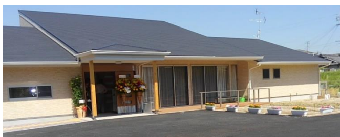
H29.6.1 交野市にオープン バリアフリーグループホーム》

④障害児通所支援事業所(寝屋川教室、北摂教室、泉北教室、河内長野教室、岸和田教室)