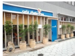
JR 玉造駅近くのカフェシャドツリー